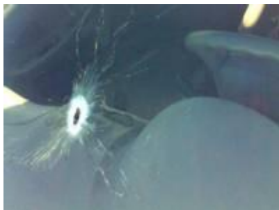
לא תקרית - פיגוע! [ועד מתיישבי שומרון]

מצד המדינה ו"מנהיגי הימין", וזאת נוכח הכאוס והאנרכיה מצד אותם גורמים בוגדניים מבית. לסיים, אציע רעיונות אפקטיביים כיצד ניתן להילחם באויבי ישראל מבחוץ, וחשוב לא פחות - כיצד יש להילחם מול האויבים מבית.