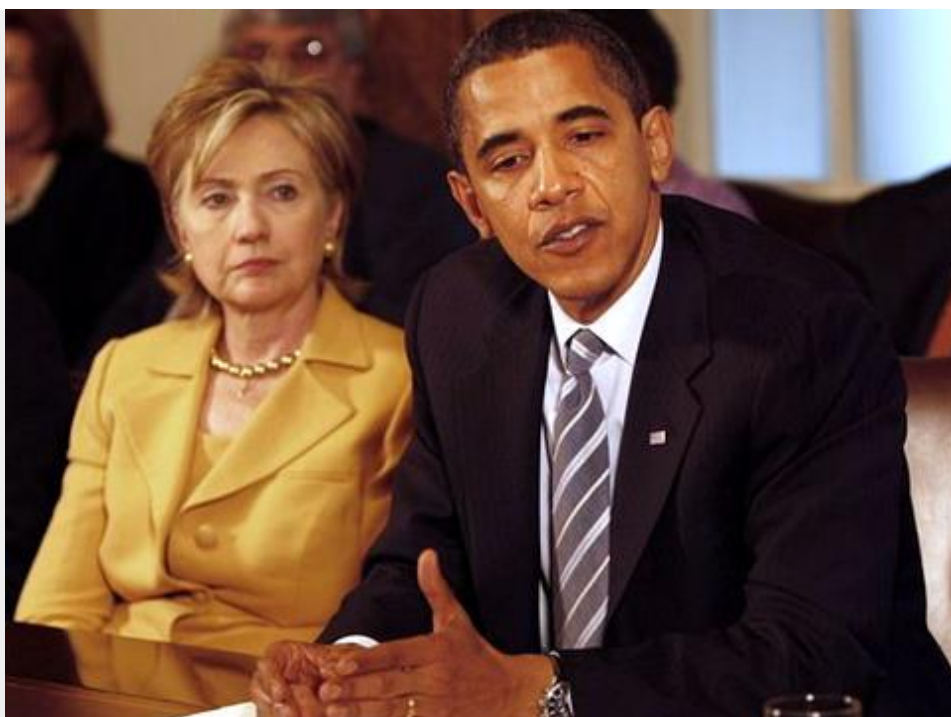
העבד המולך ברק חוסיין אובמה ומזכירת מדינת ארה"ב הפרו-פלשתינאצית הילרי קלינטון [צילום AP]: