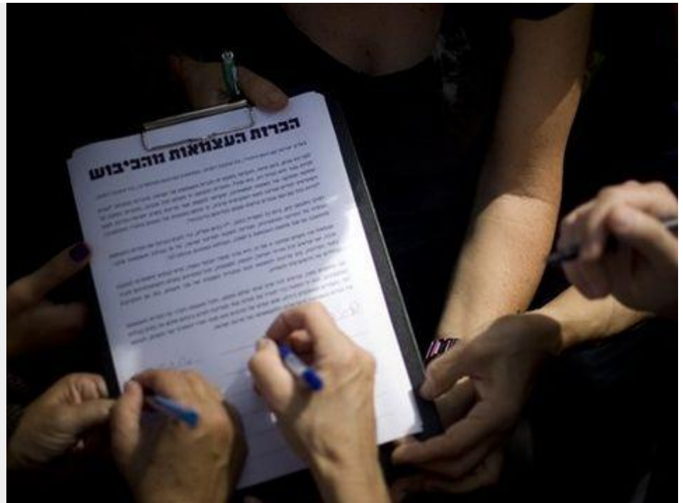
הכשרת המדינה הפלשתינית [צילום AP] :