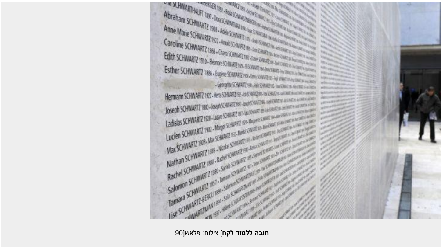
חובה ללמוד לקח] צילום: פלאש90]